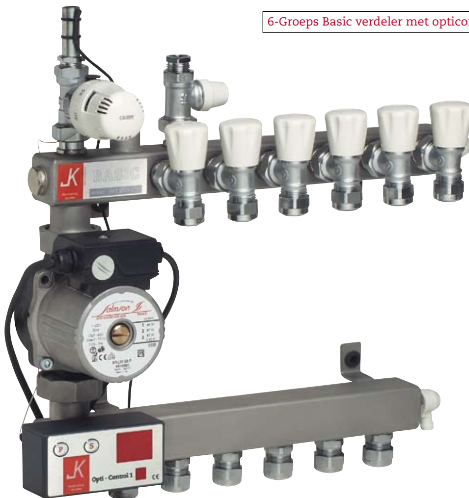
6-Groeps Basic verdeler met opticontrol® (optioneel)

De Basic- vloerverwarmingsverdeler is een uit hoogwaardige materialen en componenten samengesteld kwaliteitsproduct.